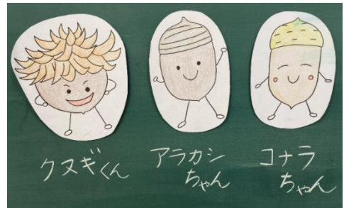
<資料3 どんぐりの特徴キャラクター>

第6～18時では、天王小周辺の公園へ何度も校外学習へでかけた。天王公園、三好公園、保田ヶ池公園、細口公園など、さまざまな公園へ出かけることで、公園ごとにどんぐりの形や葉っぱの色の違いなどがあると気付くことができた。天王公園では丸くて大きなどんぐりのクヌギ、三好公園では帽子に縞模様があるアラカシと帽子がドット柄で細長い形のコナラを見つけた。子どもたちが見つけたどんぐりの名前と形の特徴を