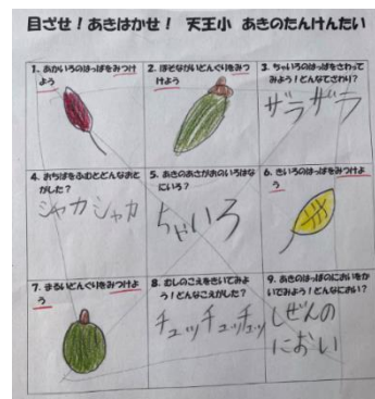
<資料2 児童Aの秋ビンゴカード>

4月に行った学校探検では、お気に入りの場所を探したり、絵を描いたりして、学校内のものや場所へ目が向くような活動を多く行った。秋になり、再び学校探検をすると、「葉っぱを踏むとシャカシャカ音がする」「アサガオが茶色くなっている」など、春や夏とは違うことに気付いた。そこで、学校内の秋を探す「秋ビンゴ」を行った(資料2)。「赤い葉っぱを見つけよう」「茶色い葉っぱを触ってみよう」「虫の声を聞いてみよう」など、五感を使って秋を見つけることで、体全体で秋を感じる事ができた。