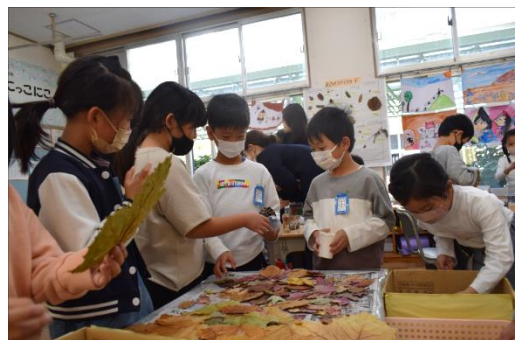
<資料９：材料コーナーで交流する児童たち>

タブレットによるおもちゃの記録は、改良の意欲を高めたり自分のおもちゃの改善点を見つけたりするために有効だった。毎時間、今回のおもちゃと前回のおもちゃを見比べて、どこが変化したか、児童自身が把握することで改良の視点や目的が明確になった。それにより、「試す→見通す→工夫する」のサイクルが子どもたちの中で自然と定着していた。さらに、材料コーナーの配置の工夫によって、各グループの作業効率を高め、グループ間の交流にもつながった。材料コーナーが児童たちの情報交換の場となっていたのである（資料９）。これらのことから、仮説２の手立てア、手立てイ、手立てウは有効であり、仮説２は妥当であると考えられる。