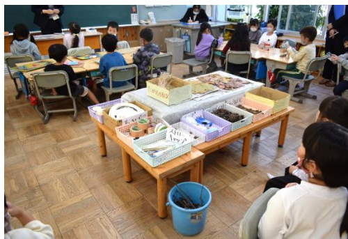
＜資料6：教室の中央に配置した材料コーナー＞

材料コーナーでは、さまざまなグループの児童が集まり、「これを使うといいよ」「今これをやっている」など、グループの垣根を越えて助言をし合ったり、改良の方法を紹介したりする様子が見られた。材料コーナーが他のグループとの情報交換の場となった（資料6）。