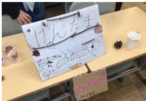
＜資料8：けん玉チームが作った看板＞

も見られた。授業後、児童Aが「100点のところに葉っぱをつけて、見た目はよくなったから、今度は的に当たったら音になるようにパリパリの葉っぱをつけたい」と言っていた。振り返りから、新たなパワーアップの方法に気付いていた。