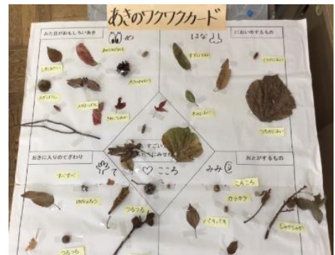
<資料4 秋のわくわくカード>

体全体で秋を感じられるように、目、耳、鼻、手、心を「秋のわくわく」と名付け、拡大したワークシートを教室に掲示した。公園で見つけた秋や、毎日児童が見つめてきた秋をワークシートに貼っていき、秋の自然物の面白さを目で見て分かるようにした(資料4)。また、宝物ボックスを教室に設置し、児童が集めた秋の物をいつでも見たり触ったりできるようにした。すると、「大きな葉っぱを拾ってきた児童から、「これで何か作りたい」、大きくて丸いクヌギのどんぐりを拾ってきた児童から、「保育園のときに作ったどんぐりゴマを作りたい」という声が挙がった。児童のお気に入りのものができてきたところで、集めた秋のものを使って何をしたいかを話し合った。どんぐりごま、けん玉、マラカス、リースなど、さまざまなおもちゃや飾りが挙がった。児童Aも、もみじを使ったリースを作りたいと意欲を示していた。これらの振り返りを基に、『秋のものがたくさんつまったおもちゃランドを開催し、他のクラスの友達を招待する』という単元のめあてを、児童と設定した。