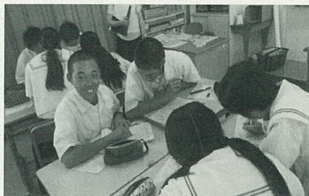
モデル文から書くときのポイントを探る生徒の様子